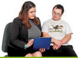
Job Coach Work Coach

Roedd llawer o bobl yn dymuno cael hyfforddwr swyddi arbenigol i weithio gyda nhw a'u teuluoedd neu rywddweithiau cymorth.